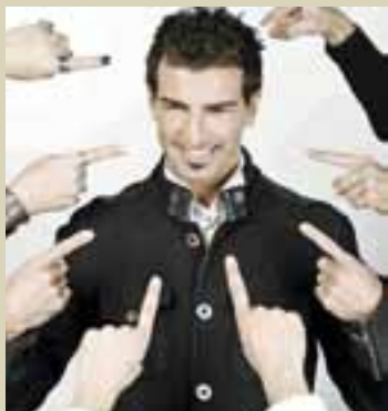
MAGO MURPHY España

Nazioarteko gala honen zeremoniako maisua. Maila honetako ikuskizunaren arrakastaren giltzetako bat da showman eta mago-komiko honen eskarmentu aberatsa.