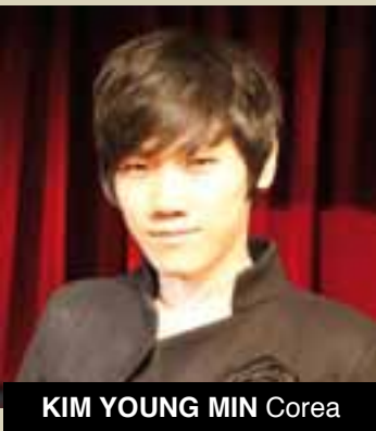
KIM YOUNG MIN Corea

Recién llegado de LAS VEGAS, este gran actor, mimo, mago y como no, cómico, se encargará de hacernos reír con su show de magia donde aparentemente nada le sale bien. Su espectáculo está lleno de sorpresas humor y efectos mágicos increíbles.