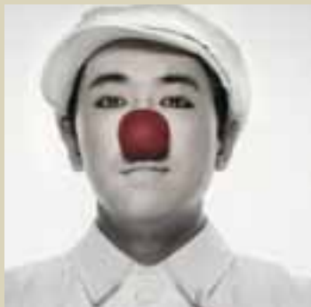
TED KIM Corea

Si la manipulación es una de las especialidades más difíciles del ilusionismo, por basarse en la habilidad pura, imagínese la dificultad técnica, si encima, se trata de naipes gigantes. Pues bien Takamitsu Uchida es el único mago en el mundo capaz de manipular cartas de casi medio metro de lado.